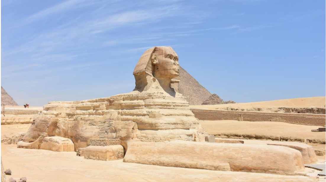
La Gran Esfinge de Guiza en Egipto.