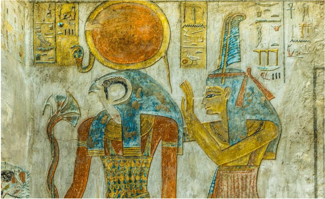
Pinturas del dios Ra y la diosa Maat, en una tumba del Valle de los Reyes (Egipto)