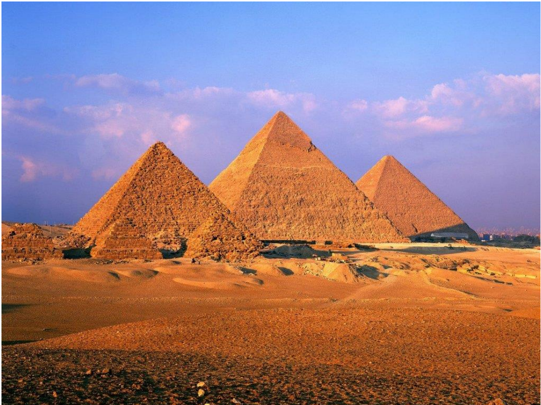
Piramides del Valle de Gizeh