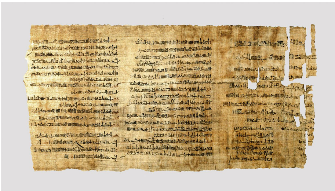
El papiro Abbott