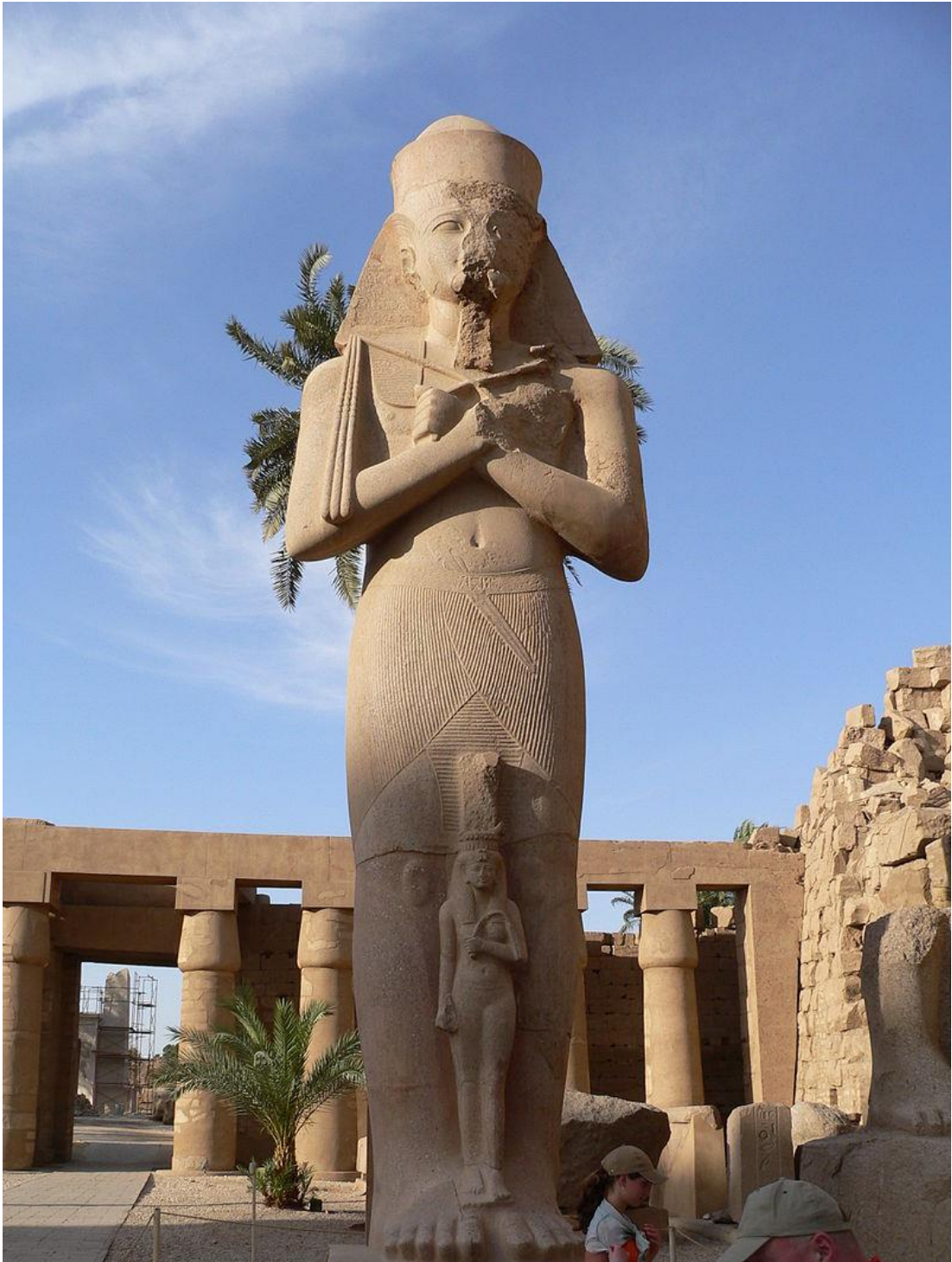
Estatua de Pinedjem I, Sumo sacerdote de Amón, situada en el primer patio del templo de Karnak.