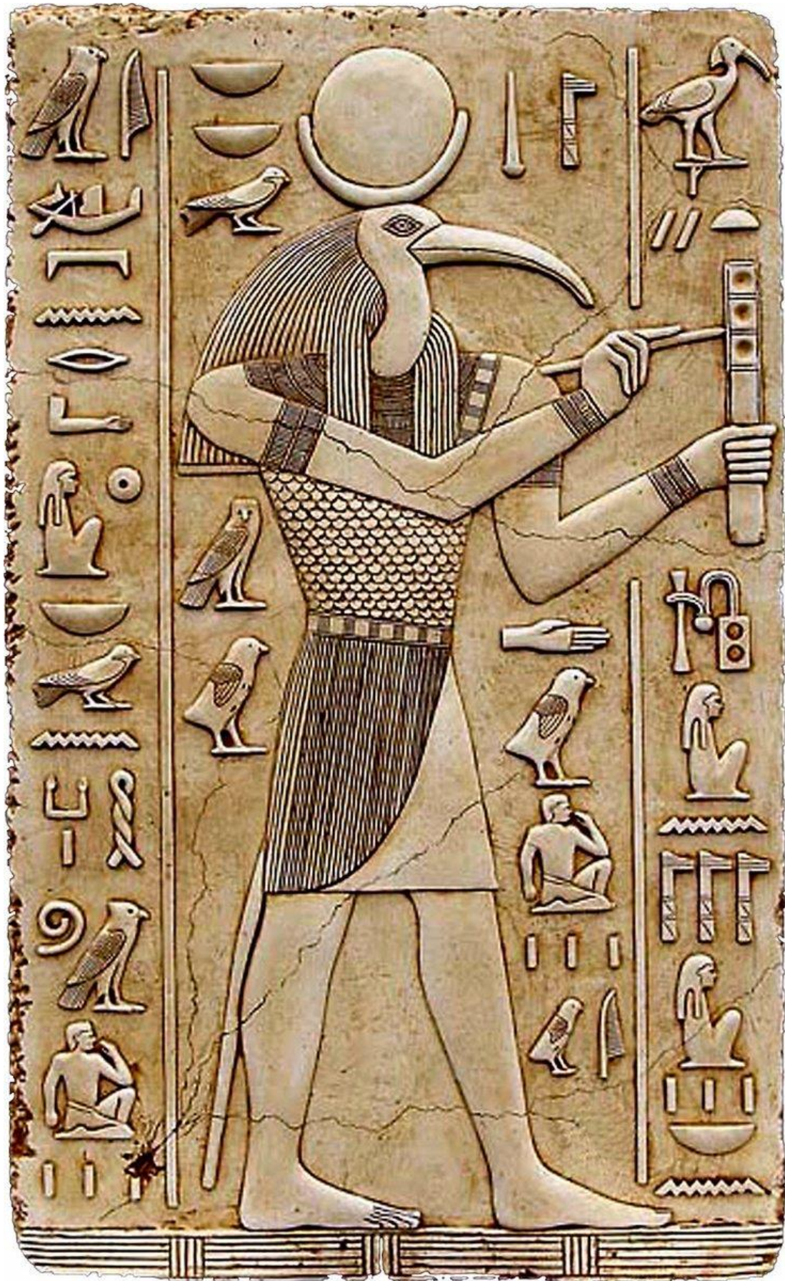
THOTH ATLENTE Y LA TABLA ESMEDALDA