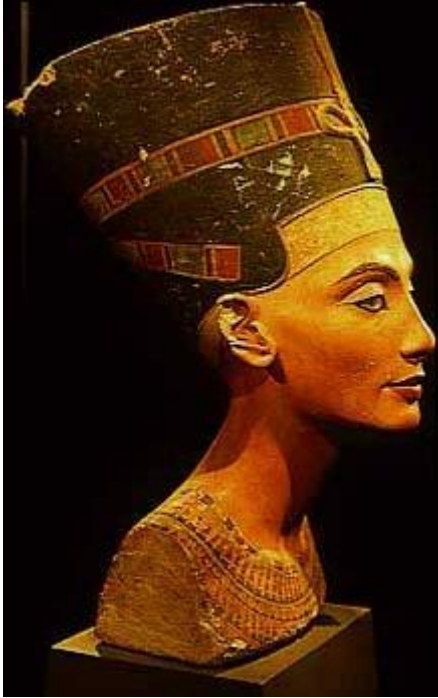
La Reina Nefertiti, esposa del faraón Amenofis IV (siglo XIV a. C.) (Museo Egipcio de Charlottenburg, Berlín).