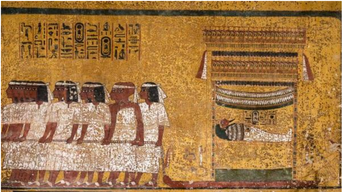
Muro de la cámara funeraria de la tumba de Tutankamón