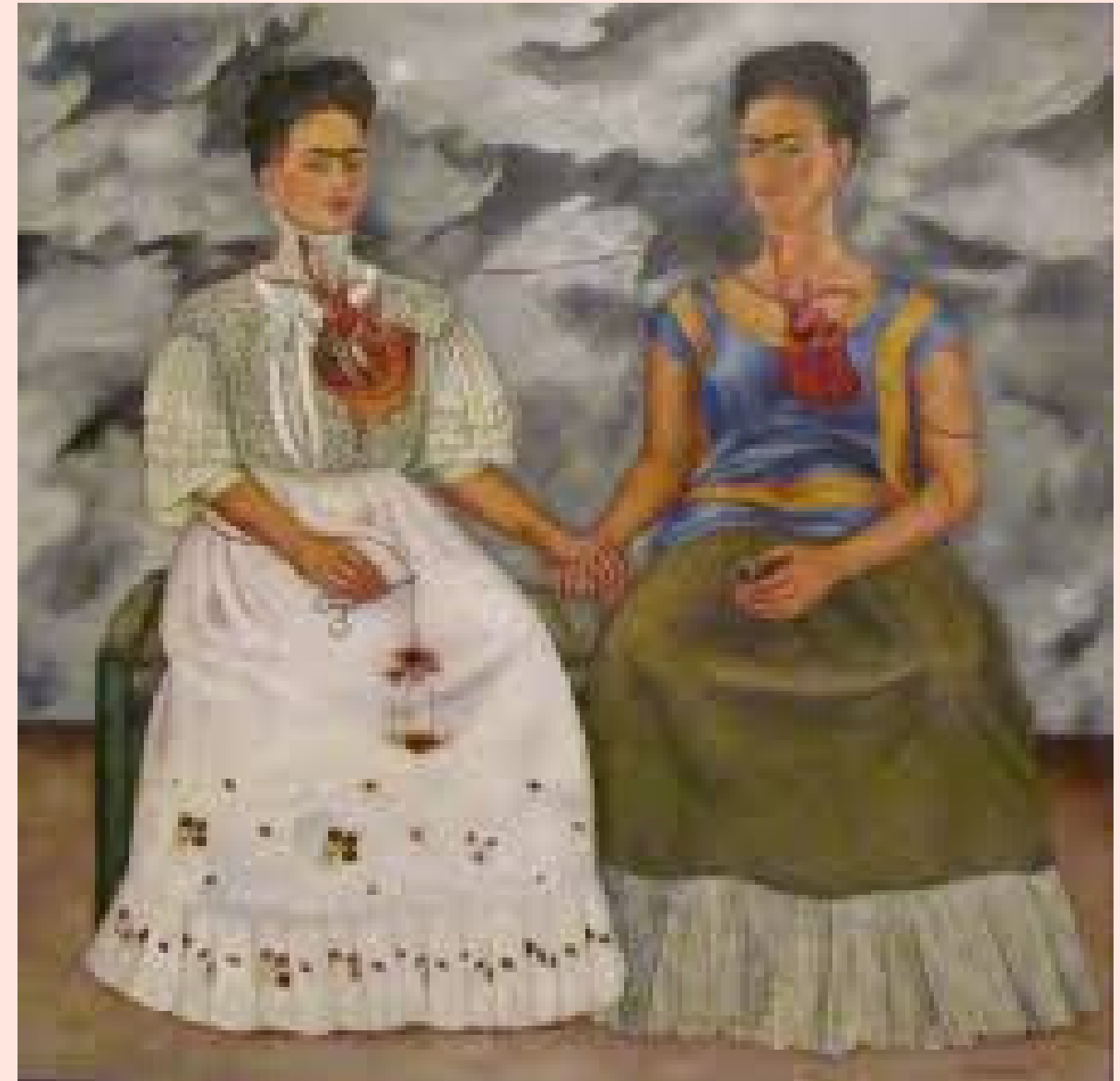
las dos Fridas