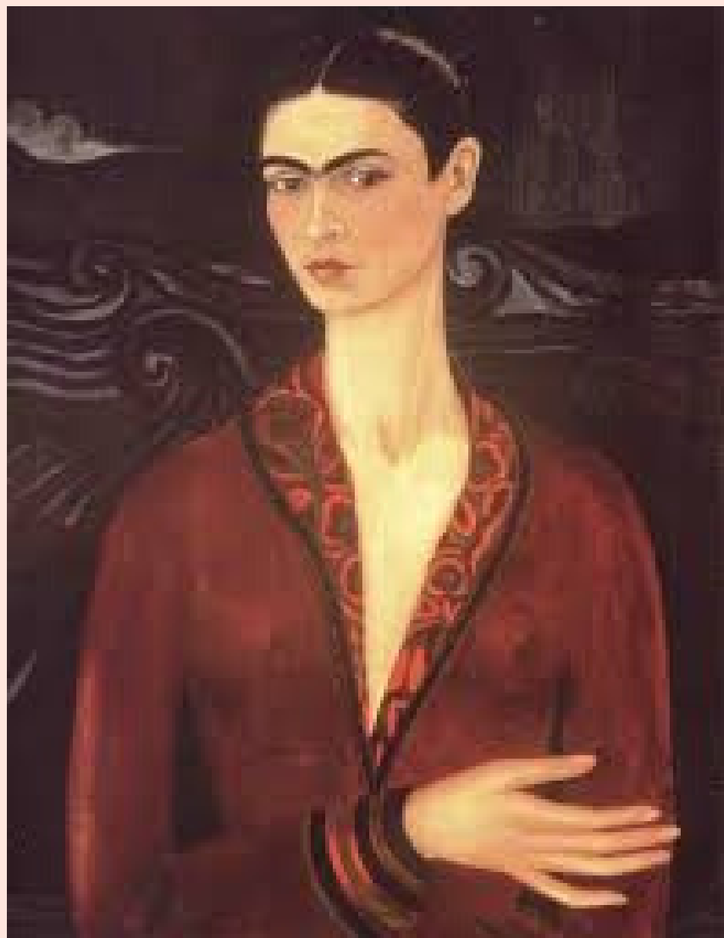
frida con vestido de terciopelo