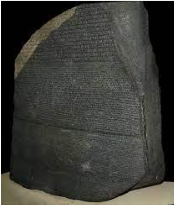
Louvre (Hammurabi - Mesopotamia)