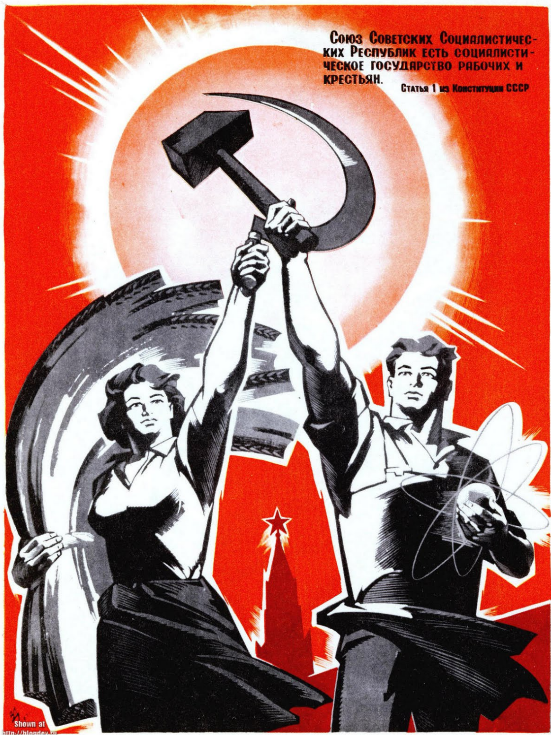
Modelo de propaganda soviética , en el que se aprecia el símbolo de la URSS, la hoz (agricultura) y el martillo (industria).