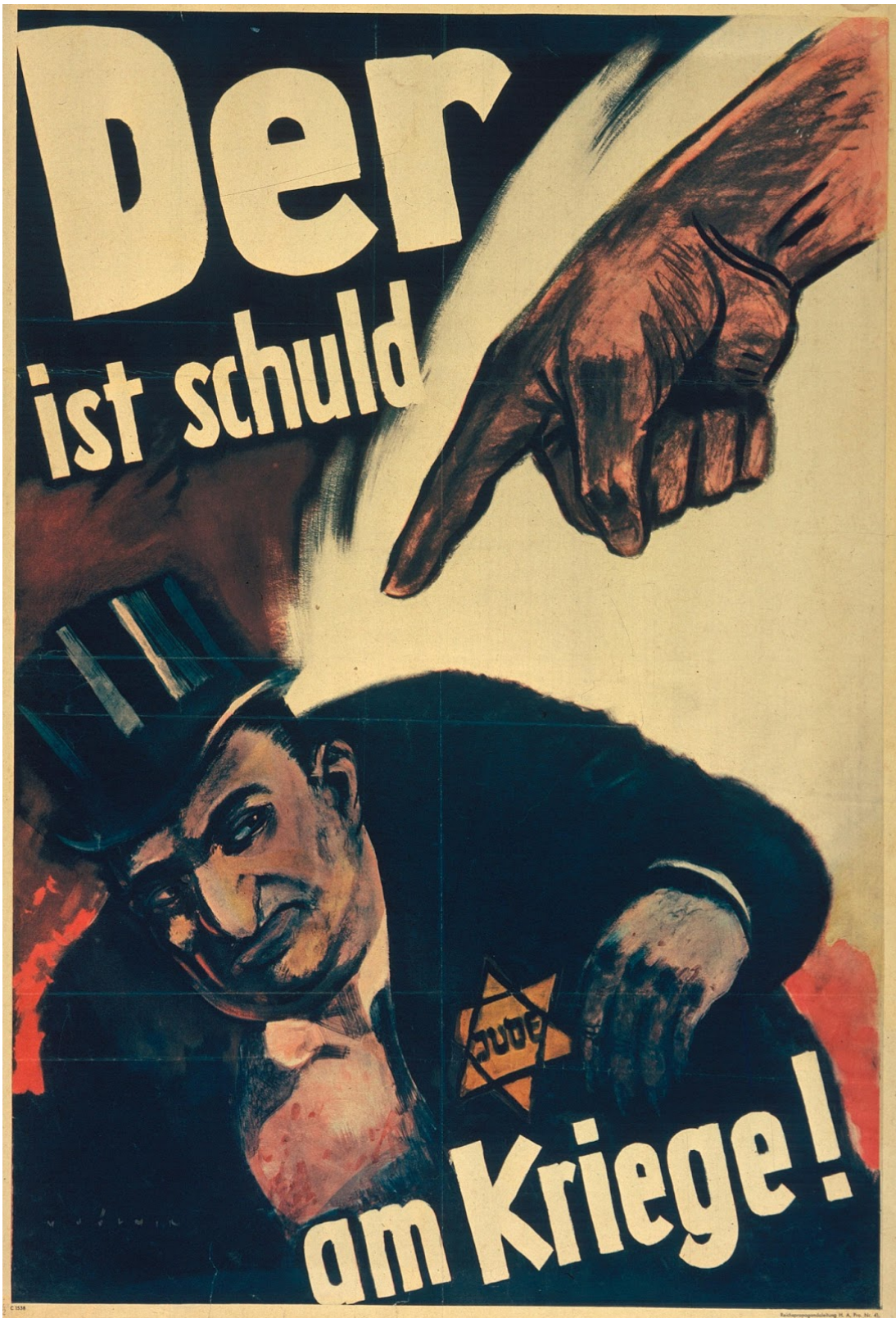
Propaganda alemana, en tiempos de Hitler, en la que se acusa directamente al pueblo judío de ser el culpable de la guerra (II GM).