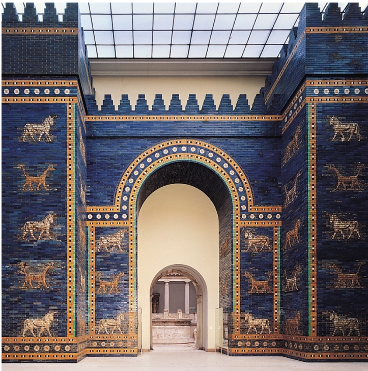
Puerta de Istar en el Museo de Pérgamo (Berlín).