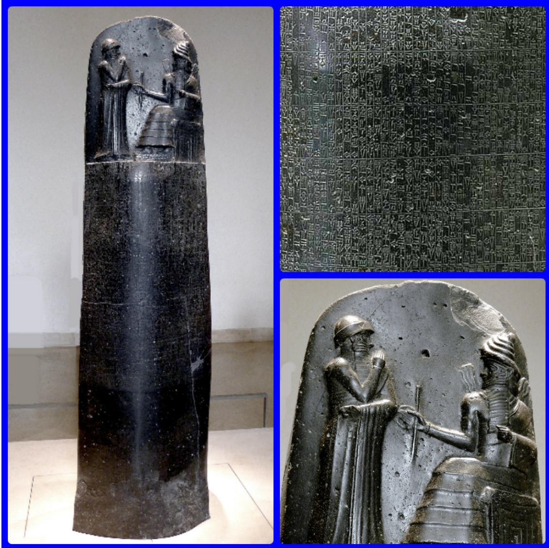
Código de Hammurabi (Museo del Louvre, París). El primer texto del que se tiene constancia.