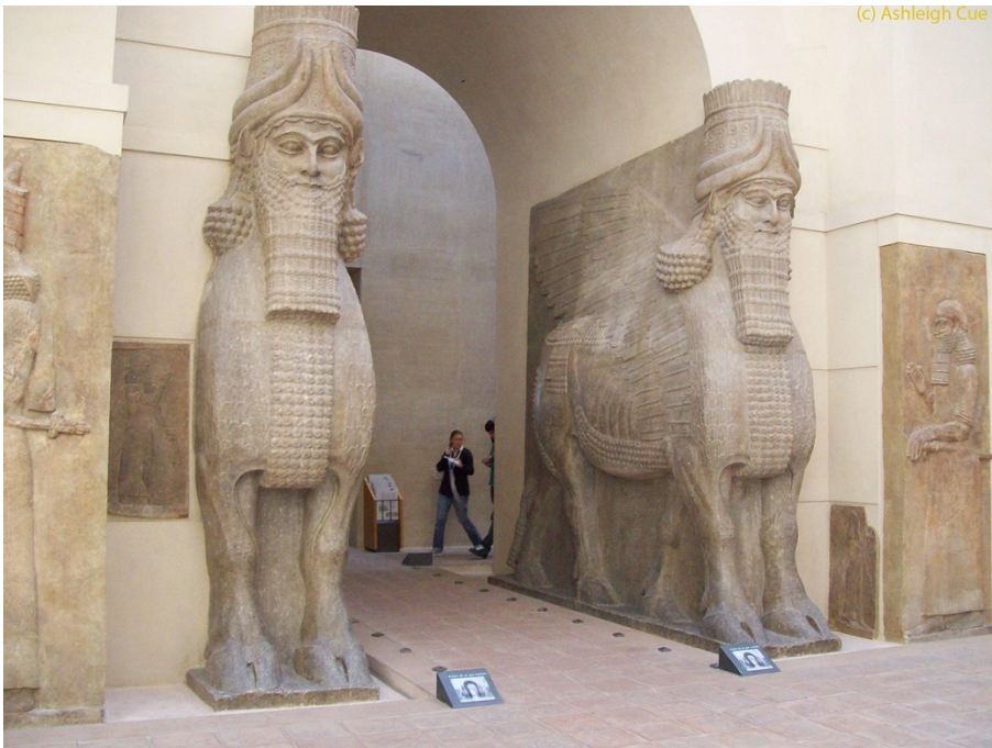
Otra obra de arte alojada en este museo alemán.